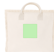
AREA 3 - Area 3