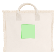
AREA 4 - Area 4