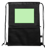
AREA 1 - Area 1

Zones et techniques d'impression disponibles pour cet article. Contactez-nous si vous souhaitez vérifier les différents types de marquage.