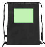
AREA 2 - Area 2